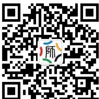
高校教师网络培训中心 微信公众号

学员可通过网培中心微信公众号进入本校院校教师在线学习中心进行学习。学员可在微信中搜索【高校教师网络培训中心】或者扫描下图二维码关注网培中心公众号，进入点击下方【学习中心】按钮，选择【院校中心】，输入用户名密码即可登入所属院校教师在线学习中心，进行选课学习。